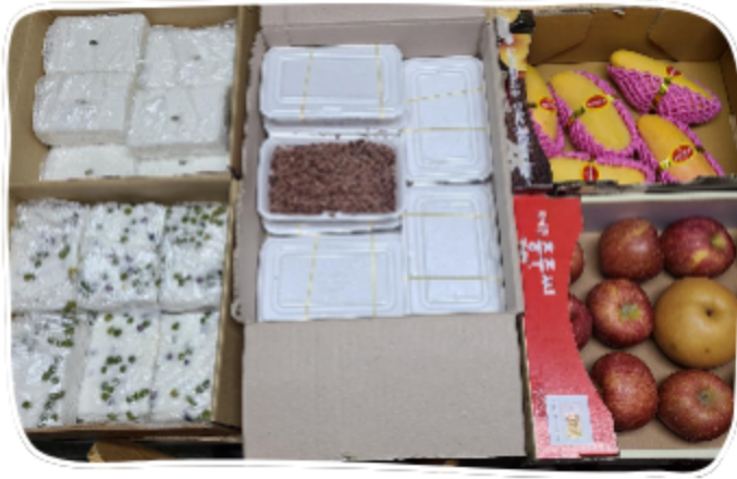
영락보린원 떡, 과일 후원