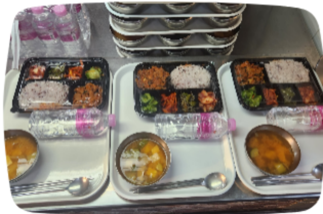
다시서기종합지원센터 도시락 및 생수 후원