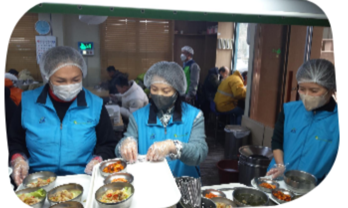
이촌 글로벌빌리지 배식봉사