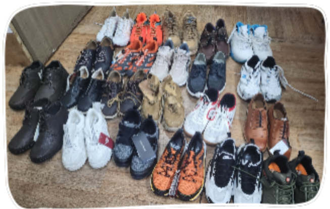
이종안 님 신발 후원