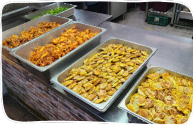
하늘이네 반찬 후원