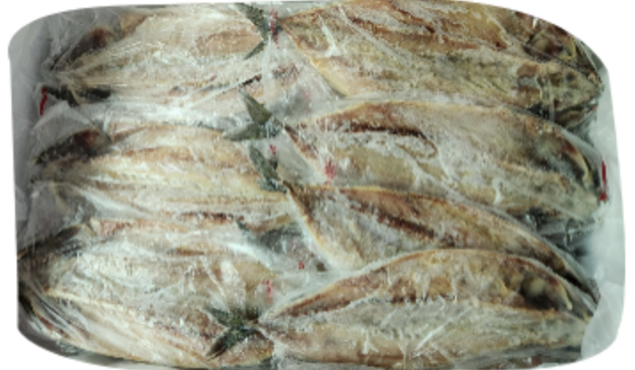
제주가 고등어자반 후원