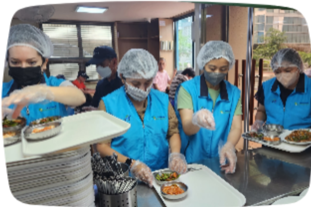
이태원 글로벌빌리지 배식봉사