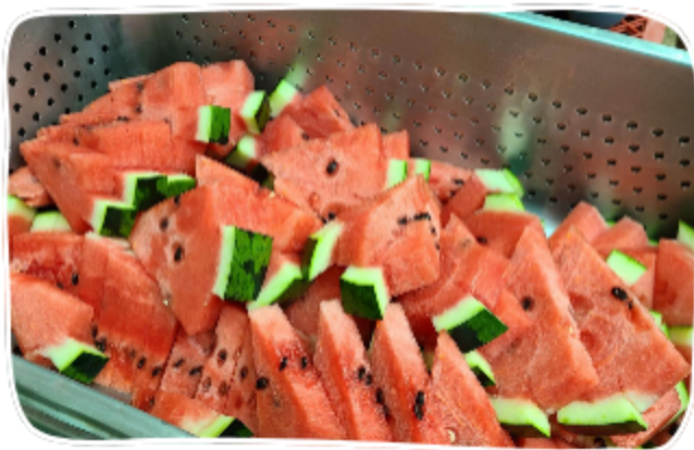
공인회계사 한진희 님 수박 후원(5통)