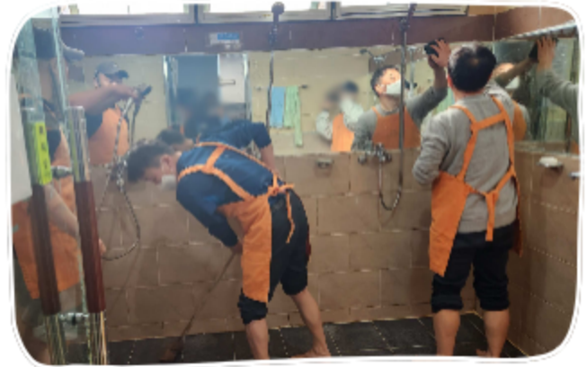
하얏트호텔 소금과 후추 청소봉사