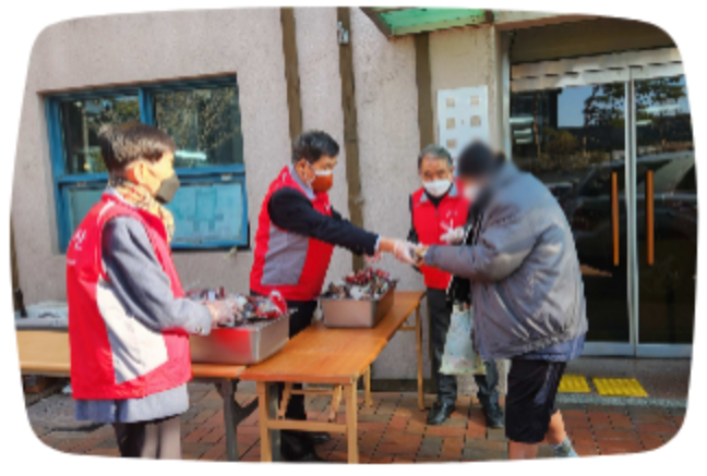
순복음선교회 물댄동산 빵 나눔봉사