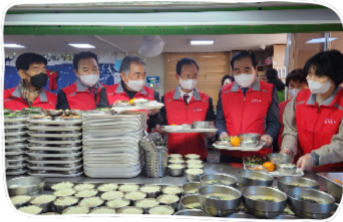
순복음선교회 물댄동산 배식봉사