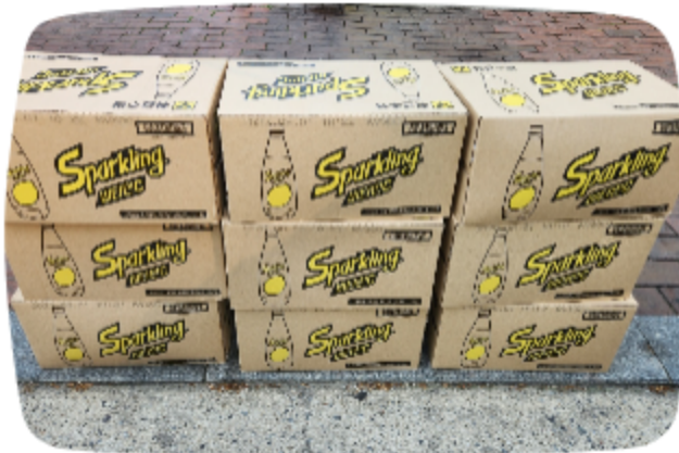
서울노숙인시설협회 음료수 후원