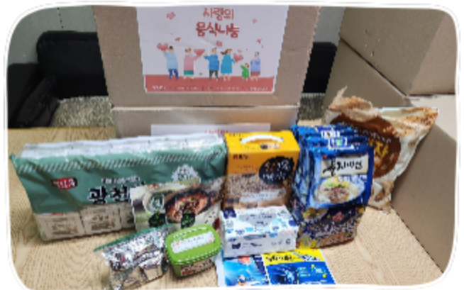
예담교회 사랑의 음식나눔박스 후원