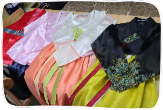
카페237(대표:김정자) 한복 후원