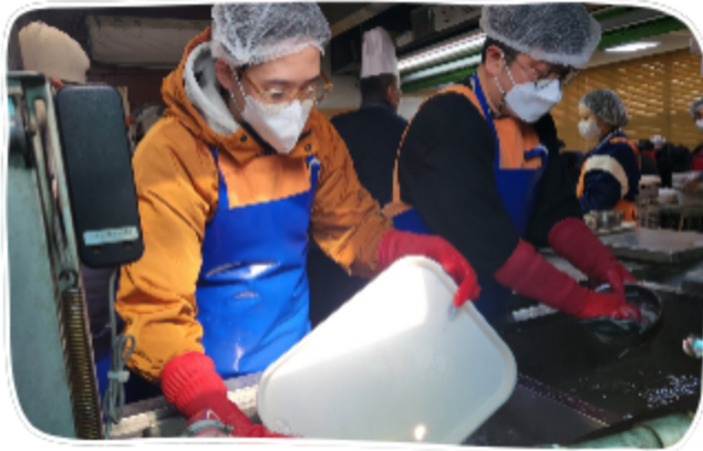
하얏트호텔 소금과 후추 배식봉사