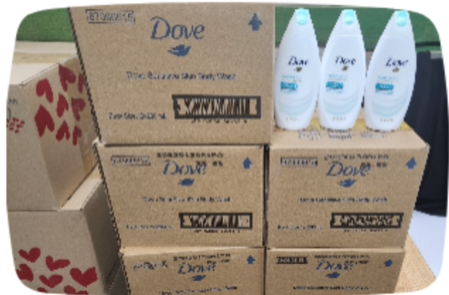
서울노숙인시설협회 바디클렌저 후원